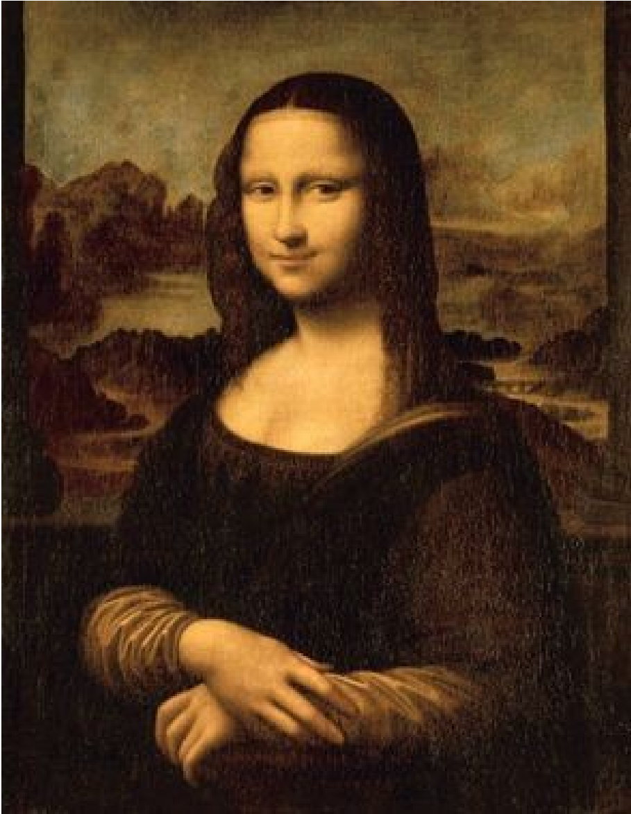
Léonard de Vinci, La Joconde