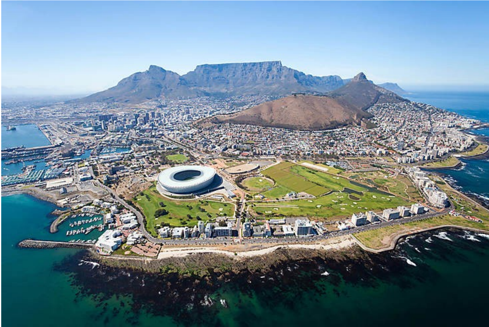
La ville du Cap en Afrique du Sud