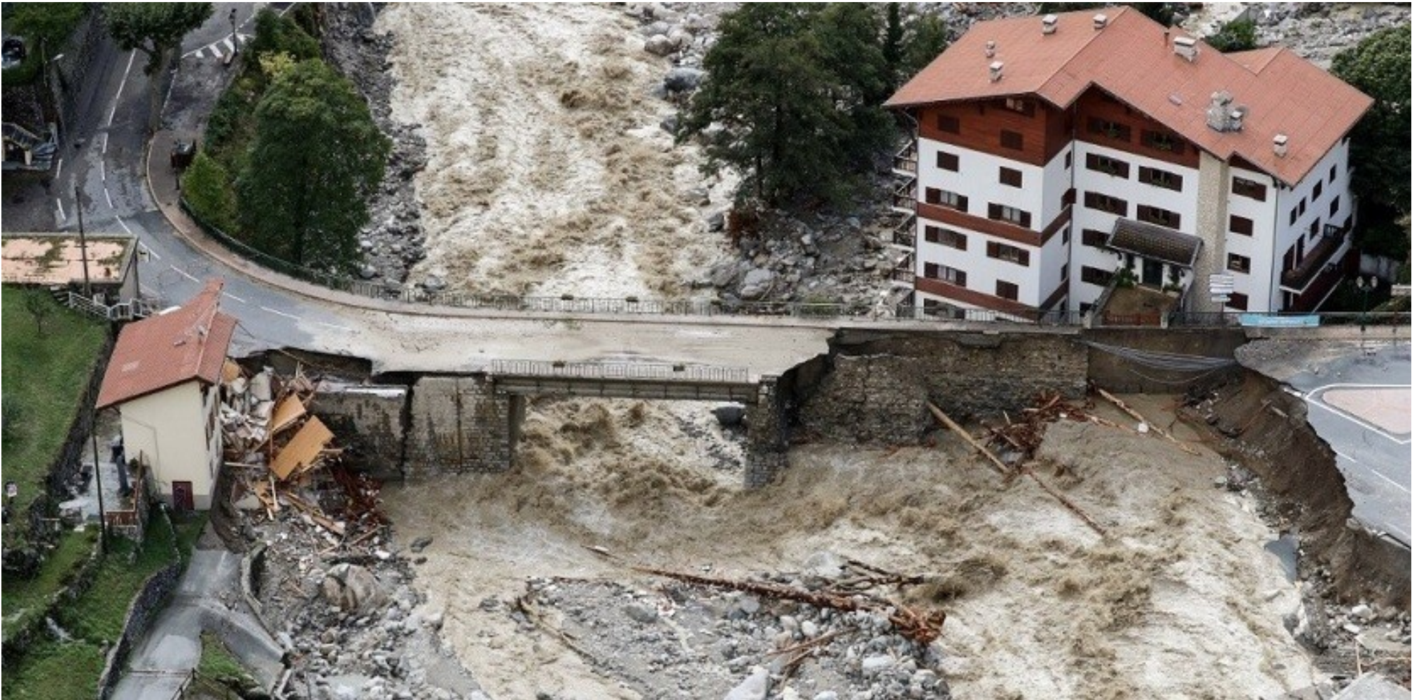
Inondation dans les Alpes Maritimes en octobre 2020