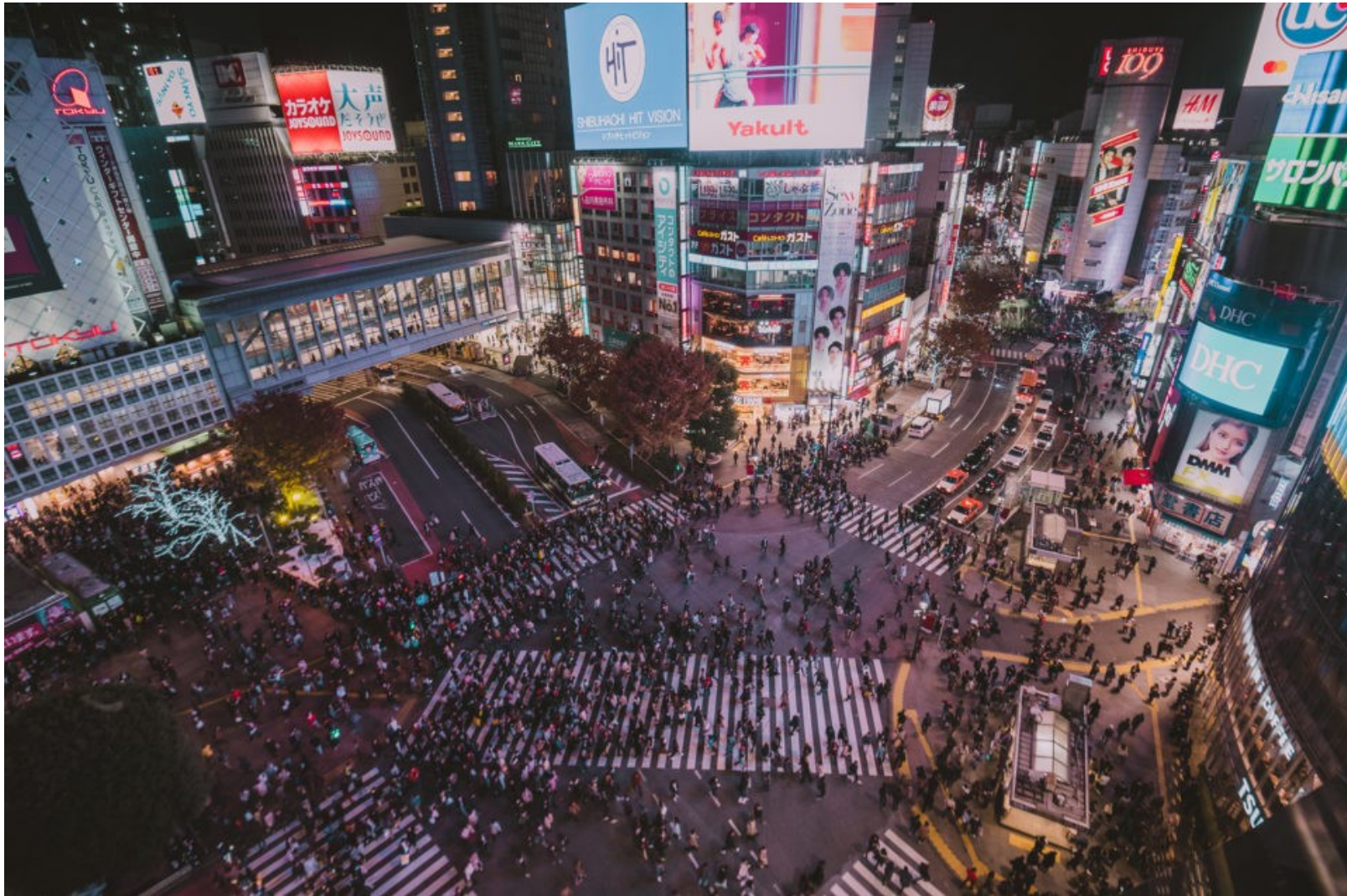
Shibuya, un quartier de Tokyo (Japon)