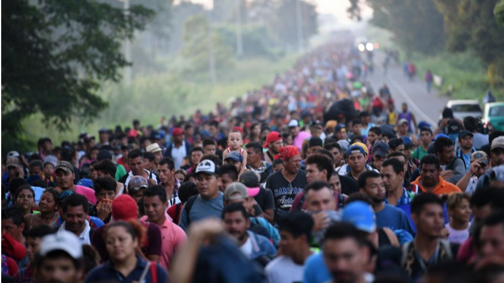
Caravane de migrants au Honduras en 2018