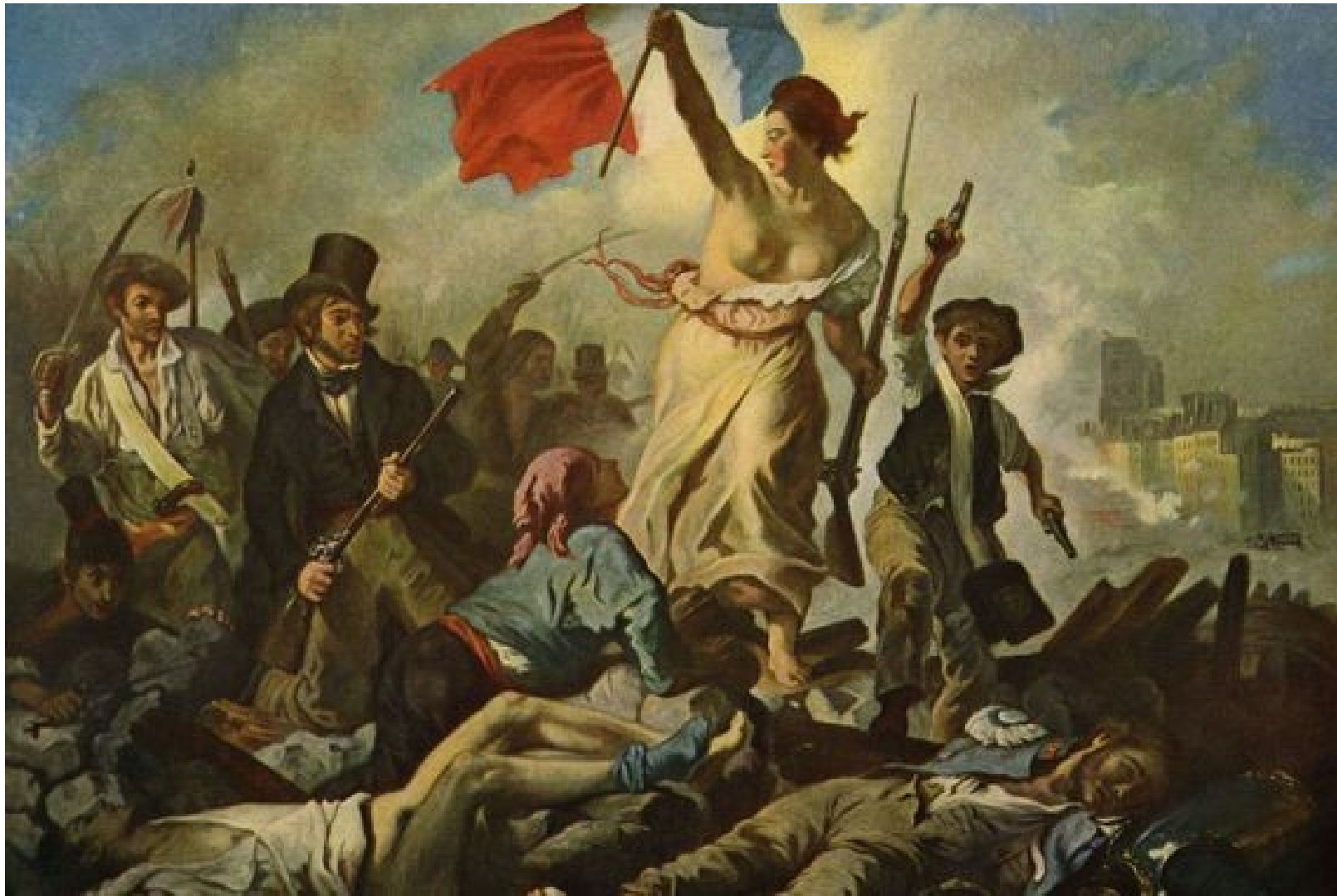
DELACROIX Eugène : La liberté guidant le peuple , 1830, huile sur toile, 260 x 325 cm, Paris, musée du Louvre